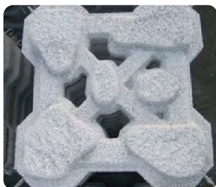
ジェロック、透水型ジェロック