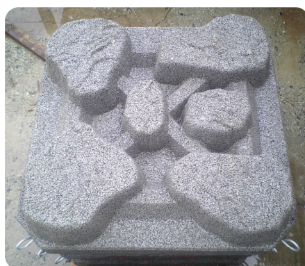
底床式透水型ジェロック