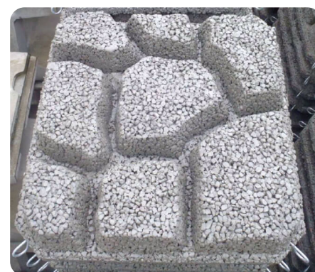
底床式透水型ジェロック割石