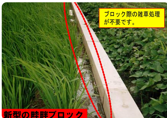
新型畦畔ブロック