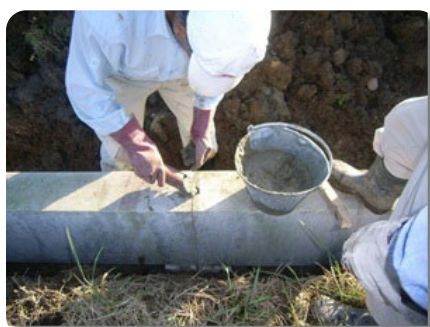
継ぎ目目地部 モルタル充填状況