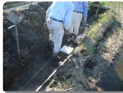
③継ぎ目部 平板設置状況