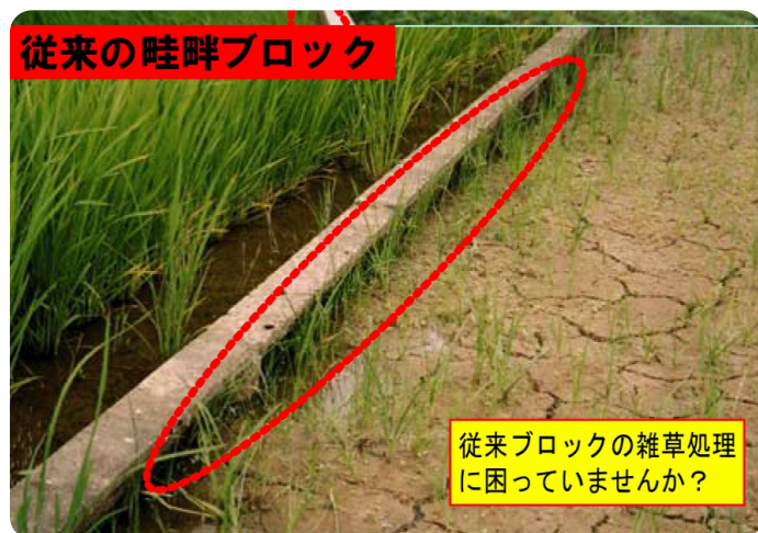
従来型畦畔ブロック