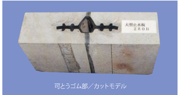
可とうゴム部/カットモデル